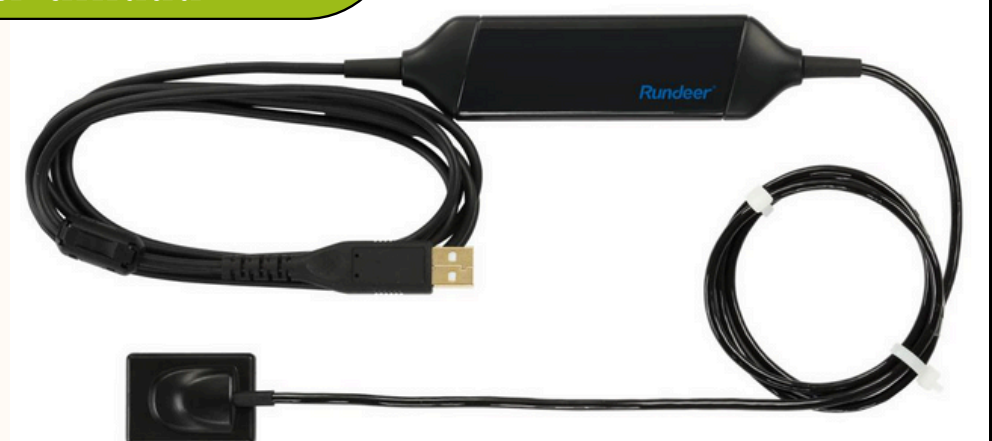
Sensor digital universal Runderer unidad