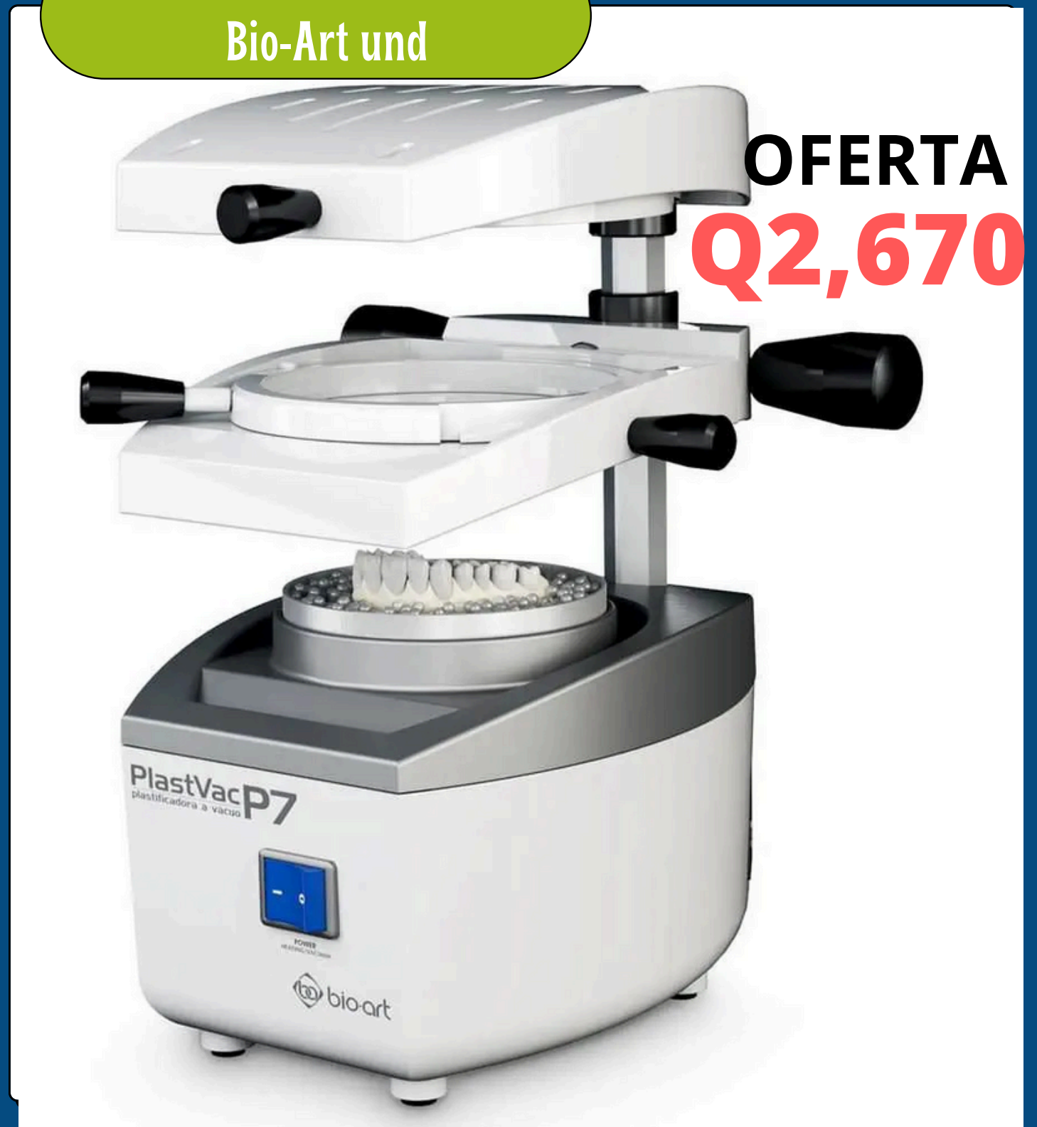
Bomba de vacío Plastvac-P7 Bio-Art und