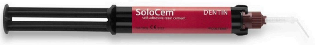
Solocem Dentin Coltene jeringa 5ml